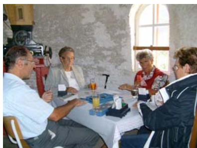
Deelnemers aan het bridgen in de molen

Op zaterdag 1 september gingen de molendeuren open voor de bridgedrive. De leden van de bridgeclub Lamswaarde reden met de fiets of de auto langs zeven locaties, waar zij telkens een half uur konden bridgen.