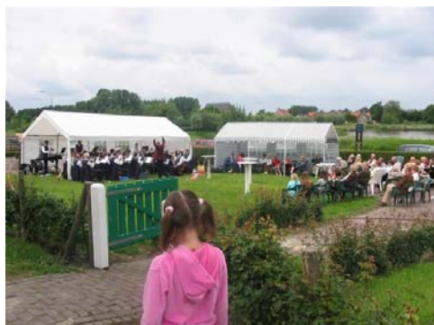
Het publiek luistert aandachtig naar de uitvoering door de Fanfare Vrijheid Eendracht uit Lamswaarde