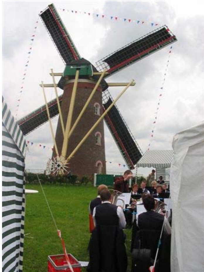
De muzikanten van Fanfare Vrijheid Eendracht uit Lamswaarde speelden de molenmars op 28 mei 2007