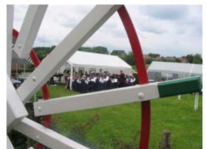
Doorkijkje door het kruirad van de molen

Op tweede pinksterdag 28 mei werd onder het motto "Blazen voor de molen", een actie van het Prins Bernard Cultuurfonds, georganiseerd. Hierbij werd bij meer dan zestig molens in Nederland, door plaatselijke harmonieën, fanfares of brassbands een concert gegeven. Zo'n concert werd om 14.00 uur geopend door het spelen van de molenmars "De Spatter". Het is een gezellige middag geworden met muziek en een hapje en een drankje. Tevens was er de mogelijkheid om een rondleiding te krijgen in de molen en maalderij door de molenaar.